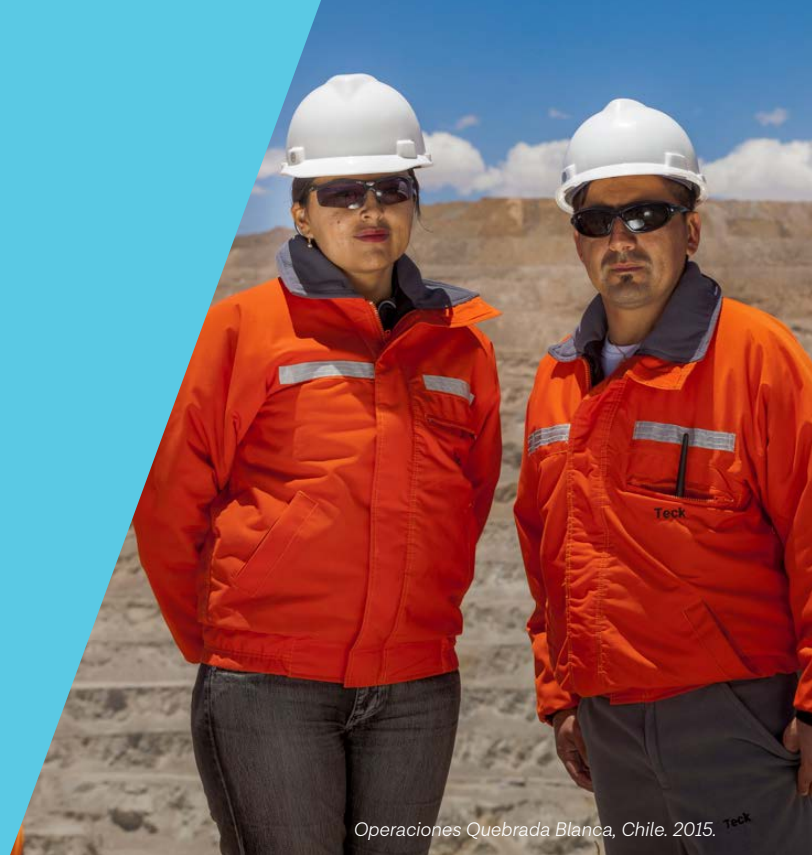
Operaciones Quebrada Blanca, Chile. 2015. Teck

Información de desempeño en Derechos Humanos: Consulte nuestro Reporte Anual de Sustentabilidad , disponible para su descarga en nuestro sitio web.